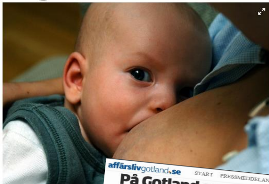
Andelen barn som helammas upp till or